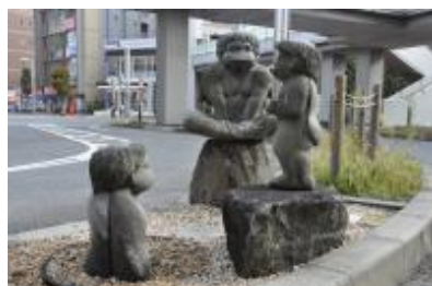
▲このカッパはどこにいるでしょう？