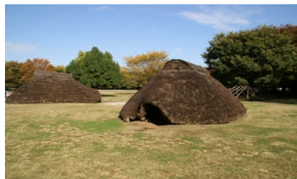
▲水子貝塚公園の竪穴住居